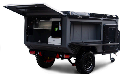
RS CAMP ES-4

ab 16.900 € inkl. MwSt zzgl. Fracht und CoC