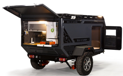
RS CAMP ES-3

ab 16.900 € inkl. MwSt zzgl. Fracht und CoC